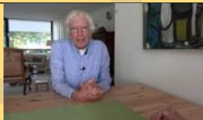
Claude over Calvijn