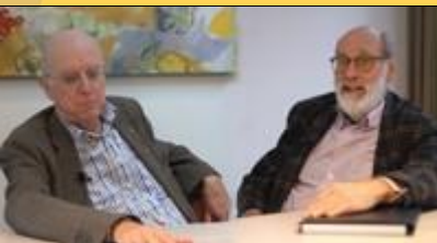
Hans en Jaap over de kindertoeslagenaffaire