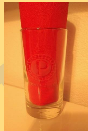
Longdrinkglas met Probustus logo en tekst