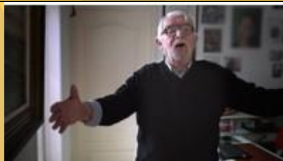
Cornelis over woelige baren