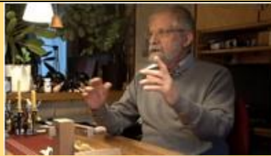
Rein over hout waar muziek in zit