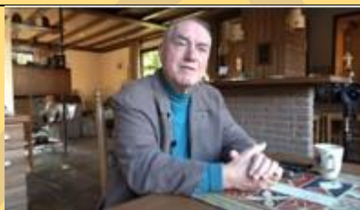
Ton over de Jacht